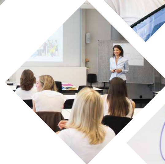
Impressionen vom Projekttag der Direktionsassistentinnen