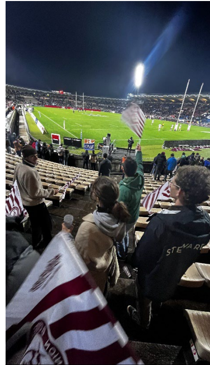
Match de rugby avec mes collègues de travail

Entre-temps, je peux vraiment comprendre beaucoup de choses et me faire comprendre suffisamment bien. Parler avec des gens de mon âge au travail m'aide beaucoup. Comme les autres stagiaires ont souvent une autre langue maternelle que le français, ils comprennent ma difficulté à prononcer certains mots. Deux fois par semaine, nous avons aussi école après le travail et nous préparons notre examen Delf B2.